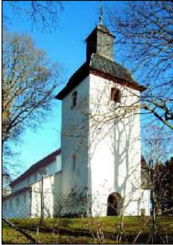
Westturm mit Haupteingang und Nordschiff