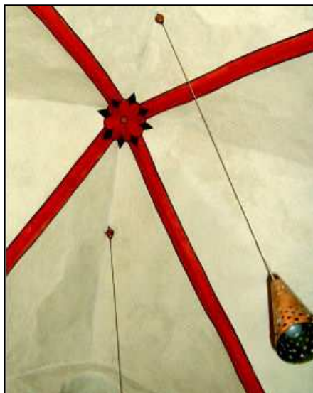
Blüte im Chorgewölbe