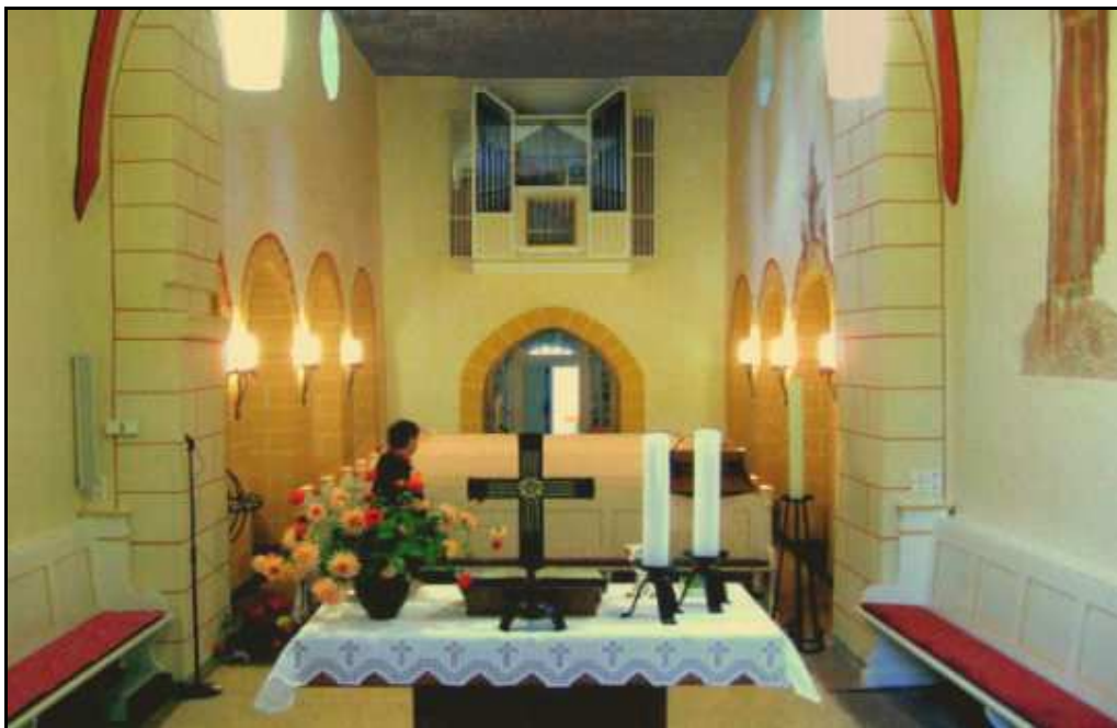
Blick ins Kirchenschiff aus dem Chorraum zum Eingang

Sogar Martin Luther, der eigentlich die Verehrung von Heiligen ablehnte, sah in Christophorus das Symbol des christlichen Menschen