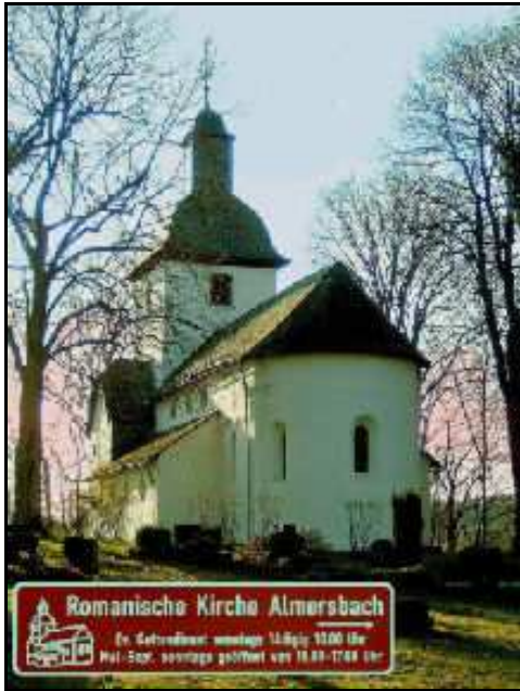
Ostseite (SO) mit Apsis & südl.Seitenschiff

Im 12. und 13. Jahrhundert, als die Kirche zu Almersbach in ihrem noch erhaltenen Innenraum entstand, führte hier ein wichtiger Handels- und Pilgerweg vorbei. Die Furt durch die Wied muss hier besonders günstig gewesen sein. Zum Schutze dieses Übergangs erhielt Almersbach die Stadtrechte (Urkunde von Kaiser Karl IV aus dem Jahr 1357 ist vorhanden). Dieser uralte Weg, der schon zur Römerzeit bezeugt worden ist, führte aus dem Köln-Bonner-Raum über Limburg in den Raum Frankfurt-Wiesbaden-Mainz-Kastell. ☼ Für die Gegenrichtung benutzte man meistens ein Schiff auf dem Rhein.