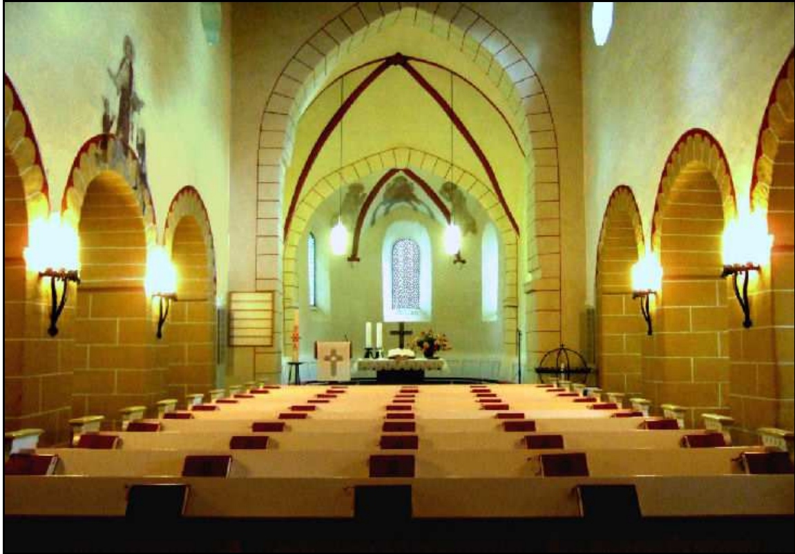
Blick ins Hauptschiff aus Richtung Turmeingang (links: Jakobus-Freske)