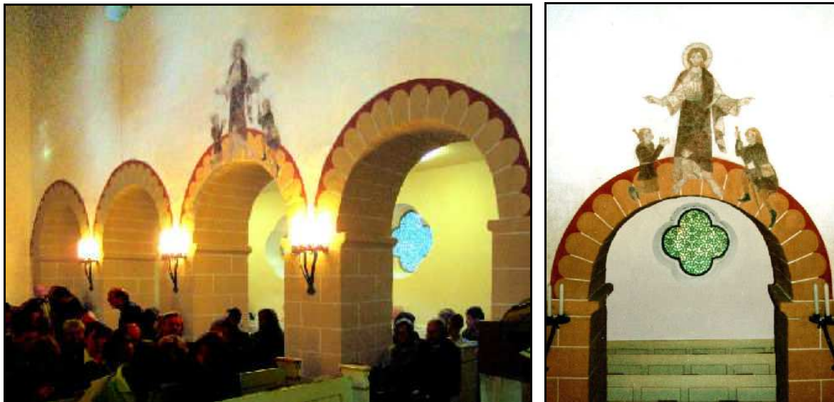
Jakobusfreske im Hauptschiff

Bei der Wandmalerei im Hauptschiff, beim "Pilgersegen durch Jakobus von Compostella", sollen 1915, als die Malereien unter einer mehrfachen Kalkschicht freigelegt wurden, noch Reste von Rittern und Reisenden vorhanden gewesen sein.