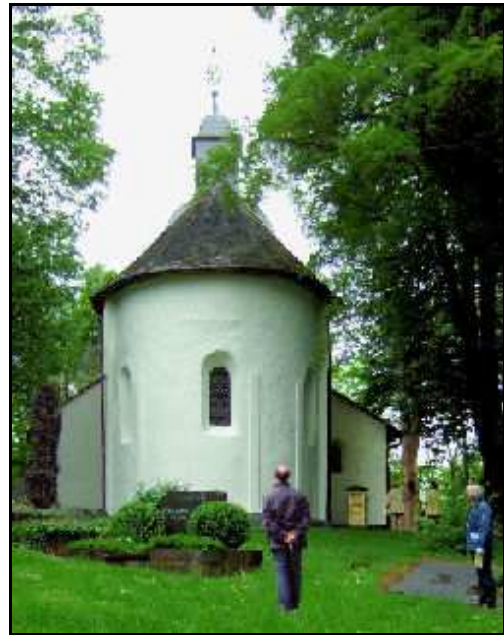
Ostseite: Apsis mit Turmspitze

Unterhalb der Almersbacher Kirche gab es eine breite aber flache Furt durch die Wied. Für die Unterbringung der Pilger und Händler wird hier ein Hospiz gestanden haben.