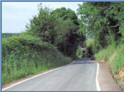
Die Kreisstraße aus Richtung Gieleroth konnte bis heute ihren Hohlwegcharakter erhalten.

Beim Viehaustrieb Anfang Mai blieben die Tiere mindestens einen halben Tag lang im Hohlweg. Dort sollten sie die Heilkräuter, die sie für die Umstellung vom Heufutter zum frischen Gras brauchten, fressen. Gleichzeitig fand dabei ihre Gewöhnung ans Tageslicht statt. 8