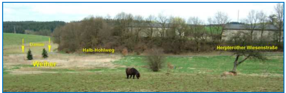
Unter der Herpterother Hühnerfarm – in der Verlängerung der Wiesenstraße – ist die einseitige Böschung des Halb-Hohlwegs aus Richtung Amteroth gut zu erkennen. Die gegenüberliegende Seite war durch einen Weiher geschützt.