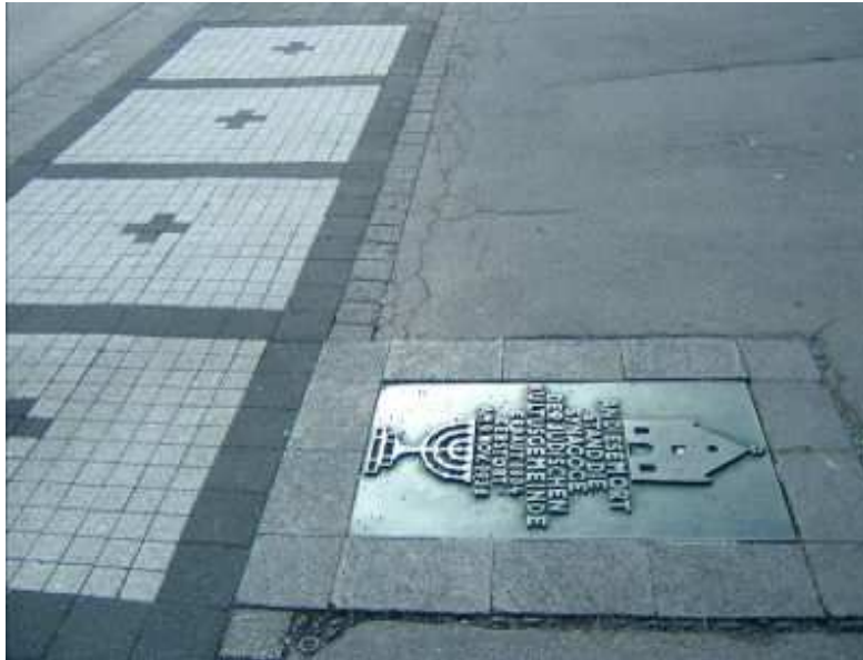
Gedenkplakette am Platz der ehemaligen Synagoge

Im Jahr 1988 wurde am Rande des Platzes, auf dem bis 1938 die Synagoge der Jüdischen Kultusgemeinde Altenkirchen stand und heute zu einer Kfz-Werkstatt gehört, von der evangelischen Kirchengemeinde und der Stadt Altenkirchen eine Gedenkplakette in den Boden eingelassen.