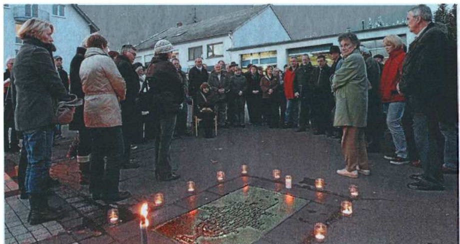
Zahlreiche Menschen kamen gestern zur Gedenkfeier am Platz der Synagoge in der Frankfurter Straße in Altenkirchen. Mit dabei war diesmal auch die Familie Abraham aus Cleveland/USA.

Während es langsam dunkler wird, Fußgänger den Bürgersteig entlanghasten, die gelblichen Straßenlaternen angehen und die Autos, die auf der Straße vorbeiraus-