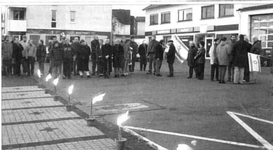
Mahnwache 2002 in Altenkirchen

Rhein-Zeitung WESTERWALD NR. 261 - MONTAG, 11. NOVEMBER 2002