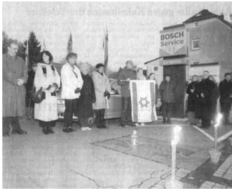
"Mahnwache" am ehemaligen Synagogenplatz in Altenkirchen am 9. November 2001

Am 9. November 2001 wurde während der Mahnwache die Nationalflagge des Staates Israel gezeigt. Am nächsten Tag war in der Lokalzeitung das nebenstehende Foto abgedruckt, auf dem einige der Teilnehmer zusammen mit dieser Flagge abgebildet waren. Eine größere Öffentlichkeit konnte sehen, dass diese Flagge von einem der Altenkirchener ev. Pfarrer und seiner Tochter gehalten wurde. 1 Einige Bürger und Bürgerinnen beanstandeten, dass die Mahnwache auf diese Weise mit einer Demonstration für den Staat Israel gleichgesetzt werden könnte. Die Regierung in Israel machte zu jener Zeit gerade Schlagzeilen durch ihr hartes