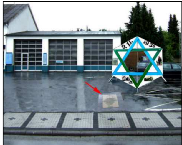
Die 7 Kreuze auf dem Bürgersteig symbolisieren die 7 Todsünden (nach der klassischen Theologie)