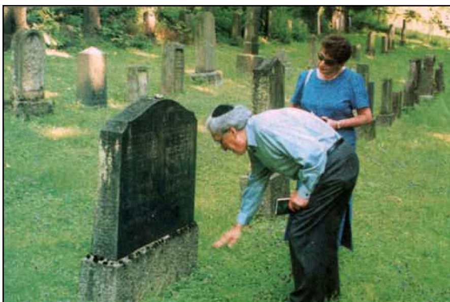
Jüdischer Friedhof in Altenkirchen mit Besuchern aus den USA (Foto am 24.8.2001 in der Rhein-Zeitung abgedruckt)

Zu einem weiteren Einsatz von Schülern kam es nicht mehr. Zwischenzeitlich wurde erkannt, dass das Hantieren mit dem Riesenbärenklau (Herkulesstaude) bei Sonnenschein zu schweren Verätzungen führt.