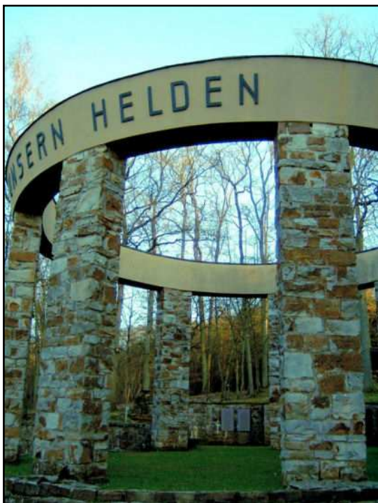
Das Altenkirchener Ehrenmal

Diese Plakette ergänzte die bereits früher angebrachte Inschrift: