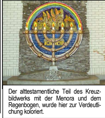
Der alttestamentliche Teil des Kreuzbildwerkes mit der Menora und dem Regenbogen, wurde hier zur Verdeutlichung koloriert.

In der Turmnische Ev. Kirche in Altenkirchen entstand während der Renovierungsarbeiten 1977 ein "Kreuzbildwerk", das auf die jüdischen Wurzeln des Christentums hinweist: "Der erste Eindruck des Bildwerkes ist der des Kreuzes auf der Weltkugel, die vom Siebenarmigen Leuchter (Menora) und dem Regenbogen (1.Mose 9,13) ihre Konturen erhält. In der Kugel erkennt man die Arche Noahs und den Bau des Turmes, dessen Spitze in den Himmel reichen sollte. Der Untergang der Stadt Altenkirchen im letzten Krieg ist angedeutet ..." 12