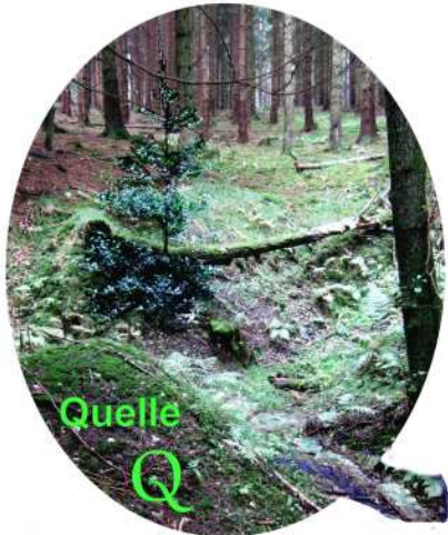
Quelle in der Nähe des Rauen Steins

Klettert man die Felswand am "Rauen Stein" hinauf, dann erreicht man oben einen Bergvorsprung. Der Berg wird in den neuen und alten Flurkarten "Johannesberg" genannt. 5 Der Festtag für den Evangelisten Johannes wird am 27. Dezember gefeiert. Dieser Tag liegt in der Zeit der "Rau-Nächte", damit ist die Zeit um "Weihnachten" gemeint. Vielleicht kommt der Name "Rauer Stein" daher, weil man sich hier besonders in den "Rau-Nächten" versammelte? Möglicherweise wurde hier Gericht gehalten, denn der Name " Rau " hat auch etwas mit "Rechtsprechung" zu tun, wie das noch im Wort "Rau-grafen" überliefert ist. 6