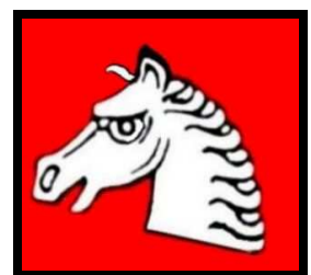
Der weiße Pferdekopf im Gielerother Wappen kann mit der Sage vom Rauen Stein verbunden werden!

Zum anderen kann "Rosch" auch von "Ross" kommen. Vielleicht wurden in diesem Tal Rösser geweidet. Der Roschbach fließt bekanntlich in den Almersbach. Der könnte einst "Ahl-Märs-Bach" geheißen haben. 2 "Ahle Mären" war ursprünglich der Name für die "ehrwürdigen Stuten". Die jungen Hengste, die man als Kampfpferde heranzog, nannte man "Rösser". Und nach einer alten Sitte aus vorchristlicher Zeit wurde jedes Jahr ein (möglichst weißes) Ross geop-